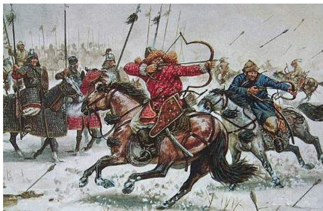
[Fuente: “Mongol horse archers” por Giuseppe Rava; Reproducido con autorización]

Giuseppe Rava, un artista de la historia militar, representa a los arqueros a caballo mongoles.