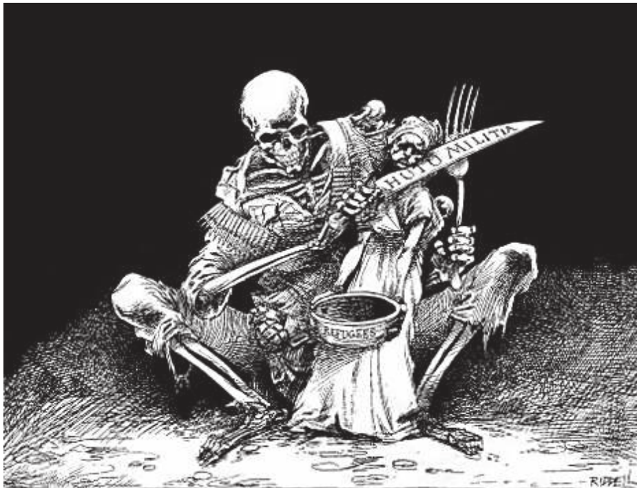
[Fuente: Chris Riddell/Guardian News & Media. Derechos de autor Guardian News & Media Ltd 2017]

Fuente R Chris Riddell, ilustrador y humorista gráfico político, caricaturiza la situación en los campamentos de refugiados en una viñeta sin título para el periódico británico The Observer (11 de noviembre de 1996). Nota: El texto en el cuchillo dice en inglés "HUTU MILITIA" y en el tazón dice "REFUGIÉS".